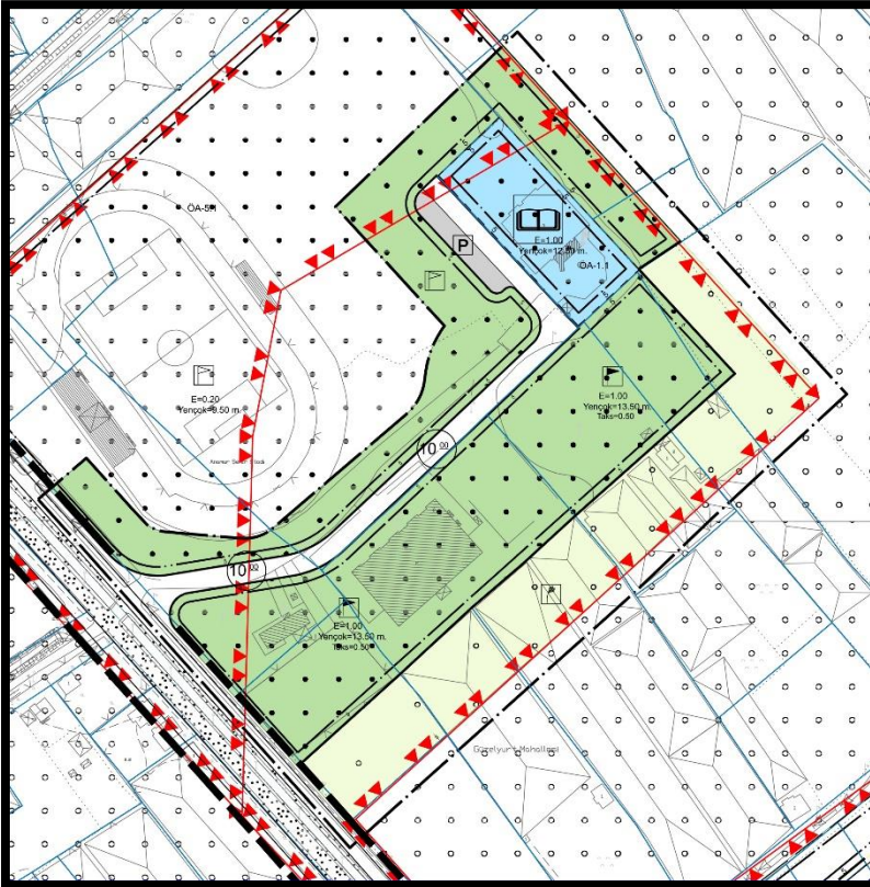
Şekil 5: Ölçeksiz Öneri Uygulama İmar Plan Durumu