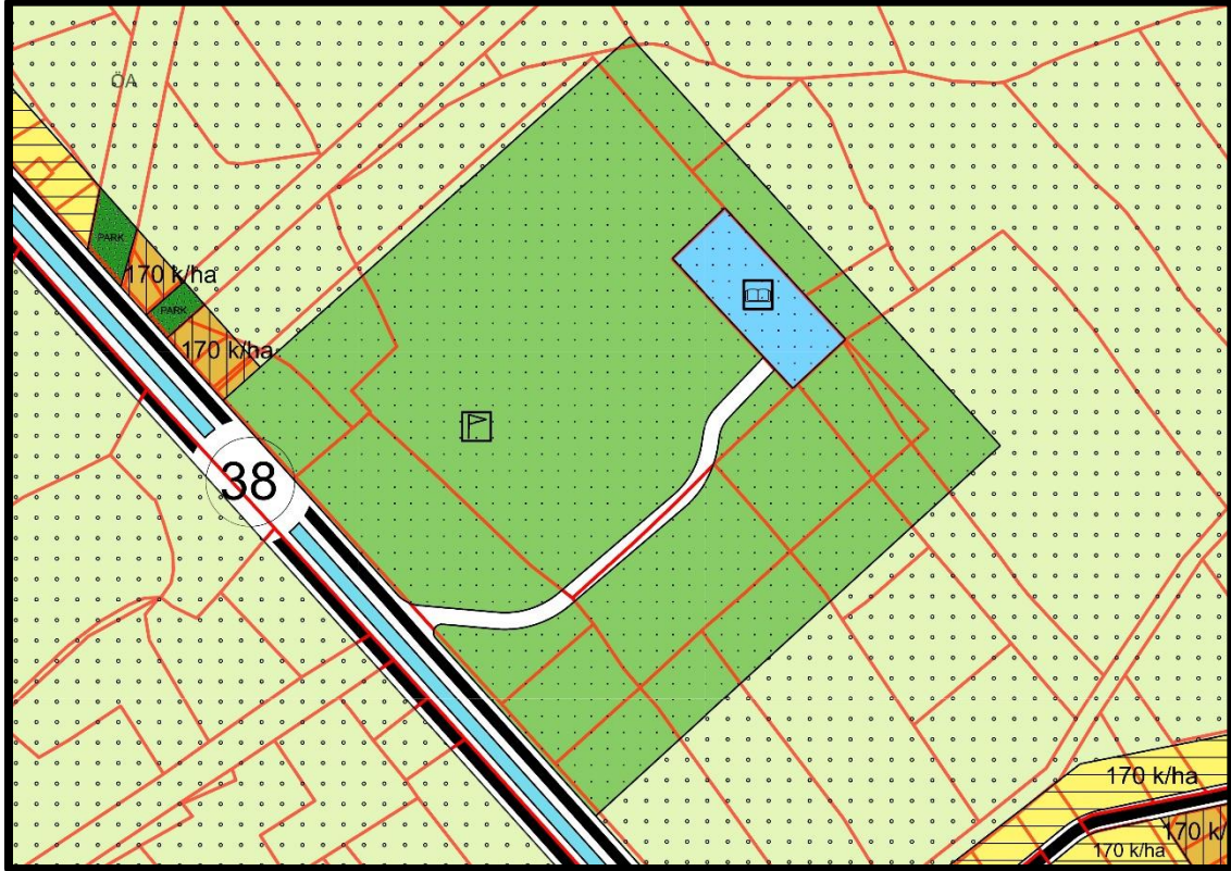
Şekil 3: Ölçeksiz Mevcut Nazım İmar Plan Durumu

Mevcut durumda planlama alanında Yol ve Açık Spor Tesisi Alanı bulunmakta olup yapılaşma koşulları; Açık Spor Tesisi Alanında E= 0.20 ve Yen\ çok= 9.50 m'dir.