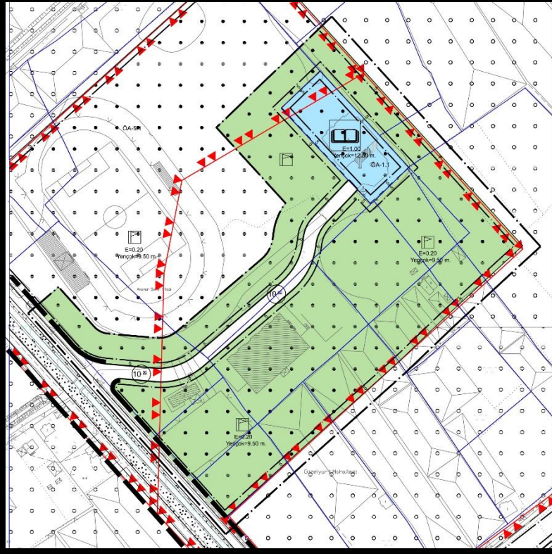
Şekil 4: Ölçeksiz Mevcut Uygulama İmar Plan Durumu